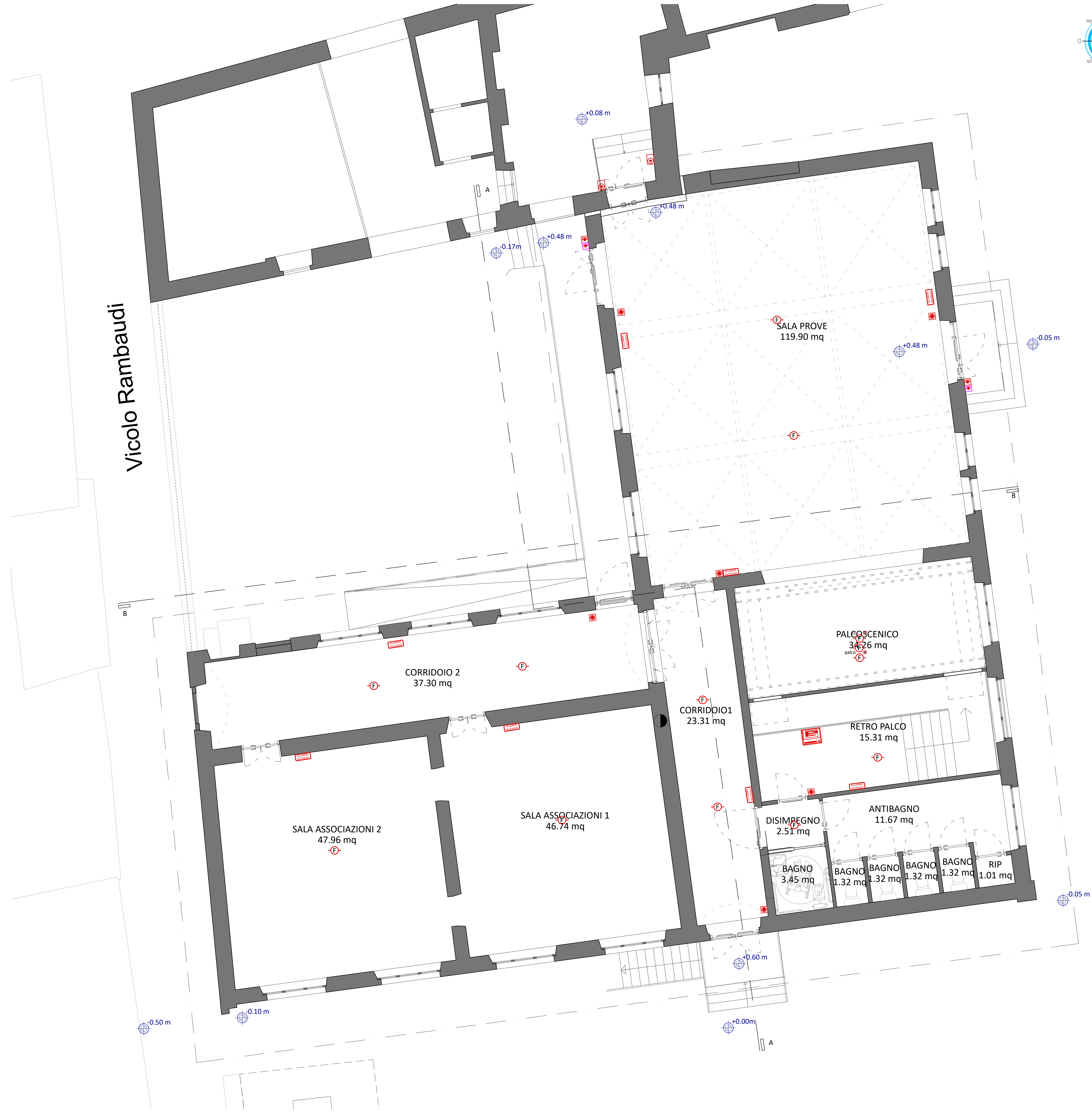
PIANTA PIANO INTERRATO